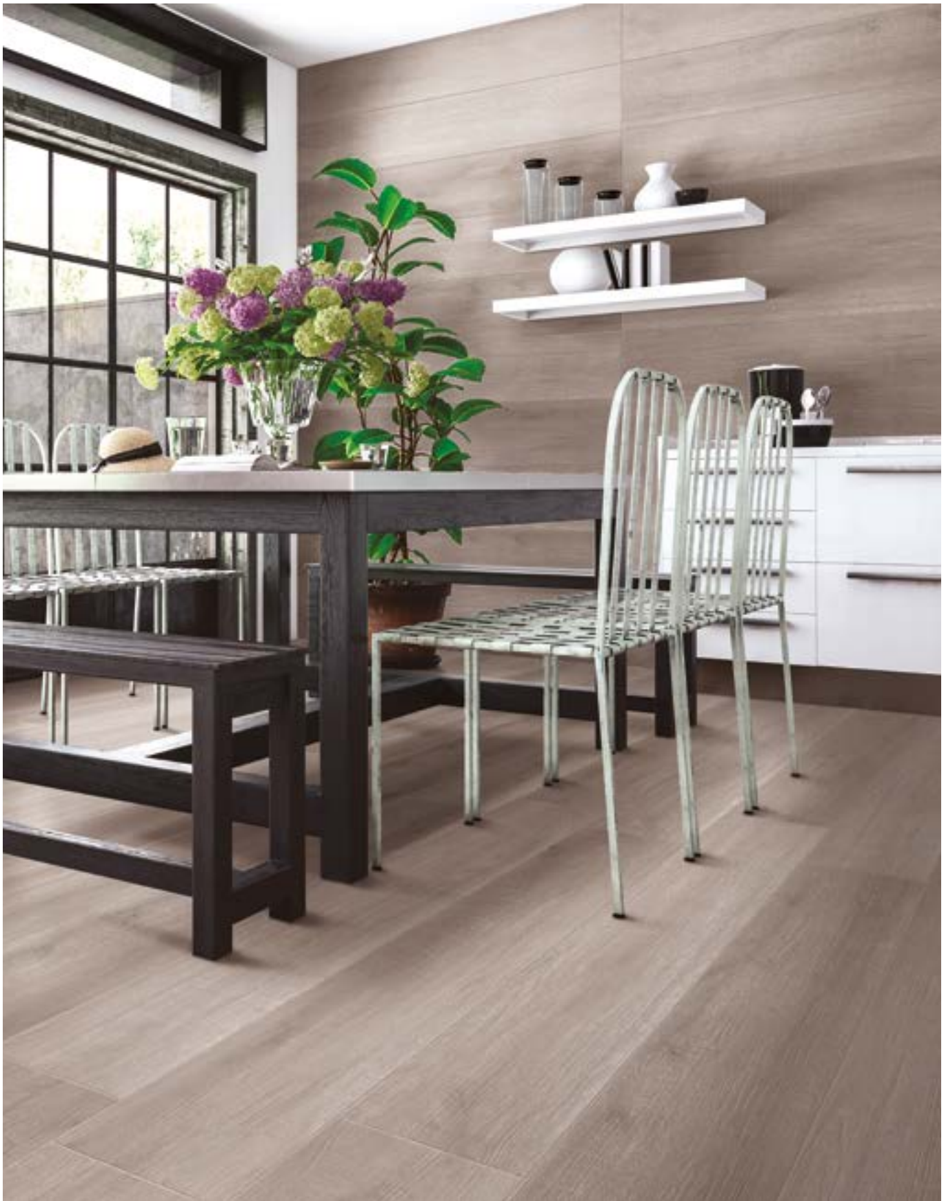
Le Plance Ash 26,5x180 . 10 1/4"x72" rett