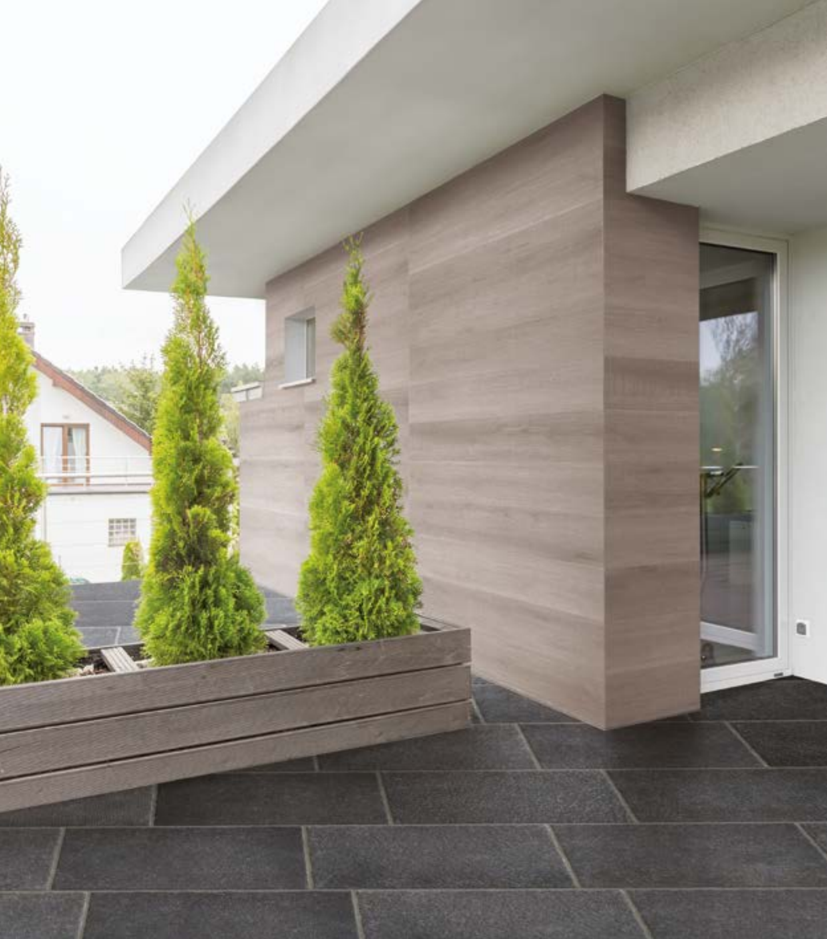
Le Plance Ash 26,5x180 . 10 1/4"x72" rett / Nevers Plus R11 40x60,8 . 16"x24" (collezione Ducato di Borgogna) 12