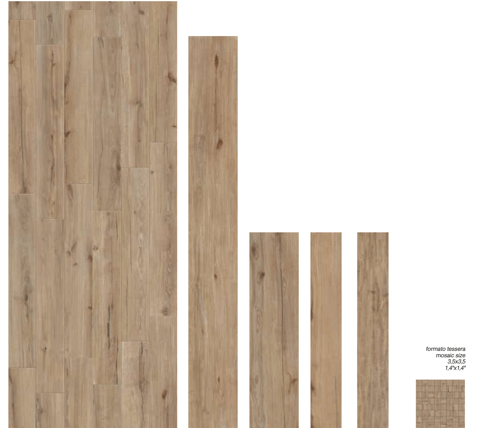
Gold 30x240 RT 12"x96" Gold 29,7x120 RT 11 7/8"x48" Gold 19,7x120 RT 7 3/4"x48" Gold 19,7x120 RT strutturato 7 3/4"x48" Gold Mosaico 29,7x29,7 12"x12"

* 14,7x120RT 5 3/4"x48 disponibile su ordinazione . available only upon request