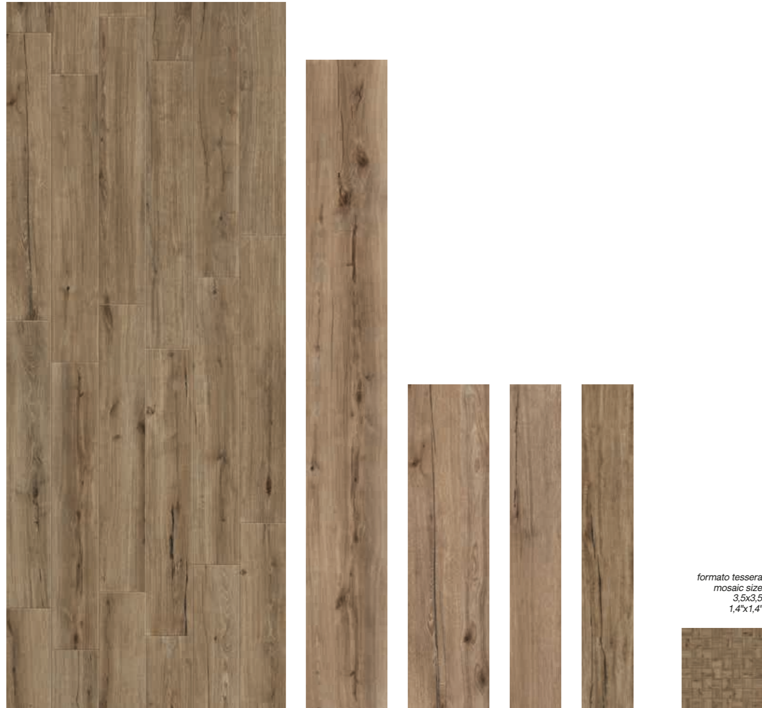
Nut 30x240 RT 12"x96" Nut 29,7x120 RT 11 7/8"x48" Nut 19,7x120 RT 7 3/4"x48" Nut 19,7x120 RT strutturato 7 3/4"x48" Nut Mosaico 29,7x29,7 12"x12"

* 14,7x120RT 5 3/4"x48 disponibile su ordinazione . available only upon request