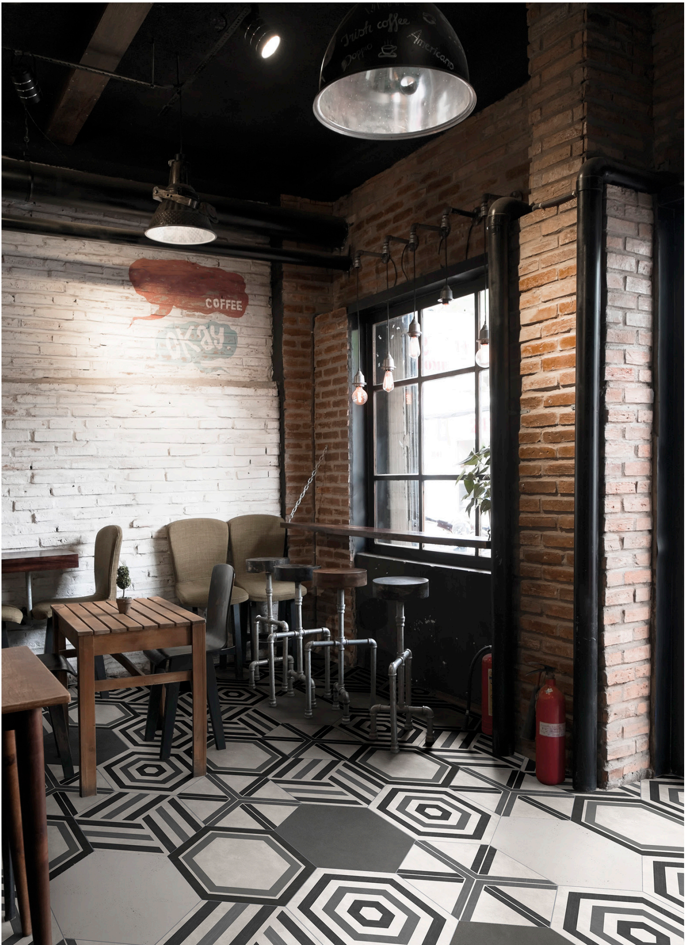
BA60W WHITE | BA60G GREY | HONEYCOMB COOL BLEND P0162420HXDC01P | RUNUP COOL BLEND P0182420HXDC01P | PLOT COOL BLEND P0172420HXDC01P | TARGET COOL BLEND P0192420HXDC01P | Ø 60 | Ø 24"