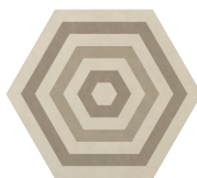
TARGET WARM BLEND P0152420HXDC01P Ø 60 | Ø 24"