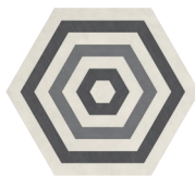
TARGET COOL BLEND P0192420HXDC01P Ø 60 | Ø 24"