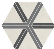
PLOT COOL BLEND P0172420HXDC01P Ø 60 | Ø 24"