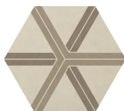
PLOT WARM BLEND P0132420HXDC01P Ø 60 | Ø 24"