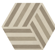
RUNUP WARM BLEND P0142420HXDC01P Ø 60 | Ø 24"