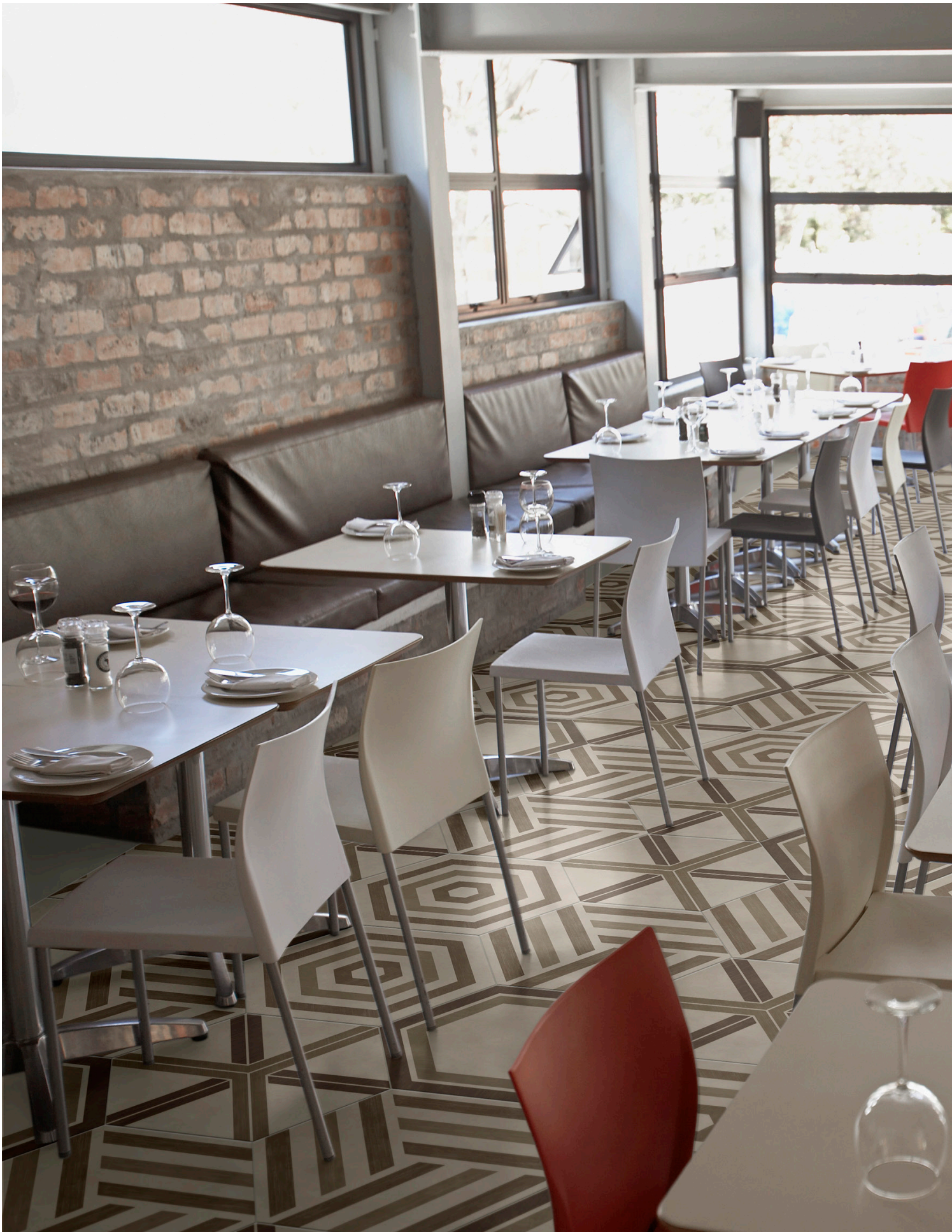
HONEYCOMB WARM BLEND P0122420HXDC01P | RUNUP WARM BLEND P0142420HXDC01P | TARGET WARM BLEND P0152420HXDC01P | Ø 60 | Ø 24"