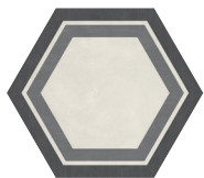
HONEYCOMB COOL BLEND P0162420HXDC01P Ø 60 | Ø 24"