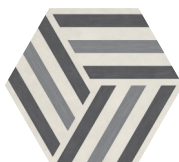
RUNUP COOL BLEND P0182420HXDC01P Ø 60 | Ø 24"