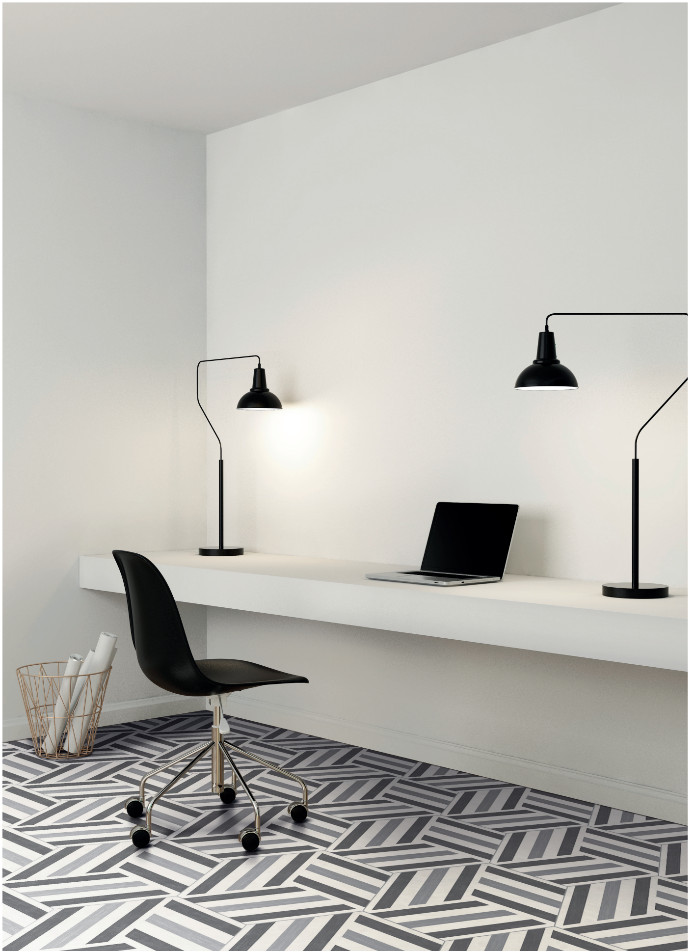
RUNUP COOL BLEND P0182420HXDCO1P | Ø 60 | Ø 24"